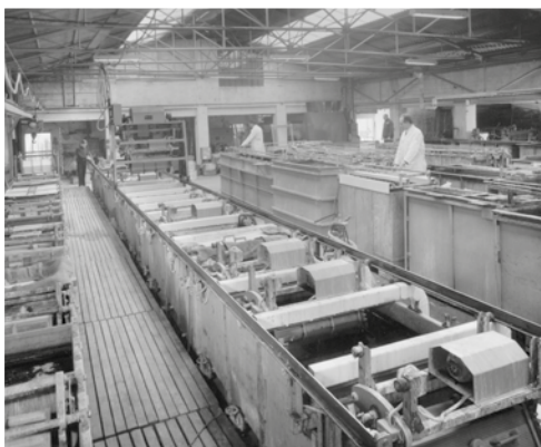
Industria Electrochimica Bergamasca. Bergamo - Longuelo.1960