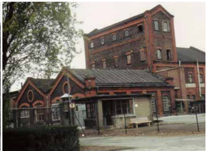
Bossong-Werk GmbH. Lintorf - Düsseldorf. 1950