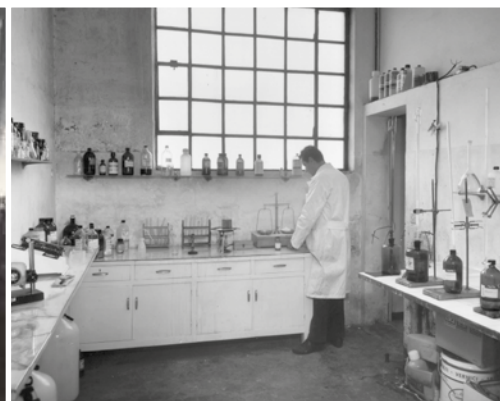
Industria Electrochimica Bergamasca. Bergamo - Longuelo.1960