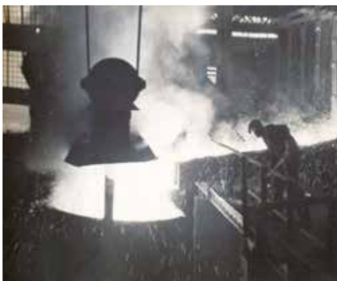
Acciaierie Dalmine > Steelworks Dalmine. 1940