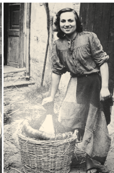
Vetreria Taddei di Castelfiorentino. Castelfiorentino. 1890/1940