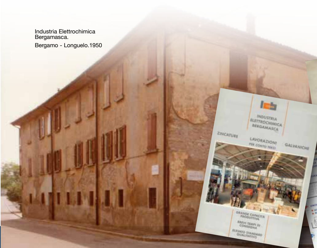
Industria Electrochimica Bergamasca. Bergamo - Longuelo.1950