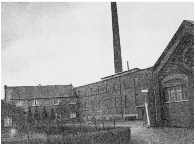
Bossong-Werk GmbH. Lintorf - Düsseldorf. 1944

It was after the Second World War that he moved from the automotive sector into the field of nail machines and fasteners, following a trip to the USA, where he had seen a nail gun and realised its potential for development in Germany. In fact the full phase of development was during the reconstruction years in Germany, when Bossong, at a time of great turmoil for the building industry, used the operational system of a pistol to drive a nail into concrete, as well as to fix steel bars and wooden planks.